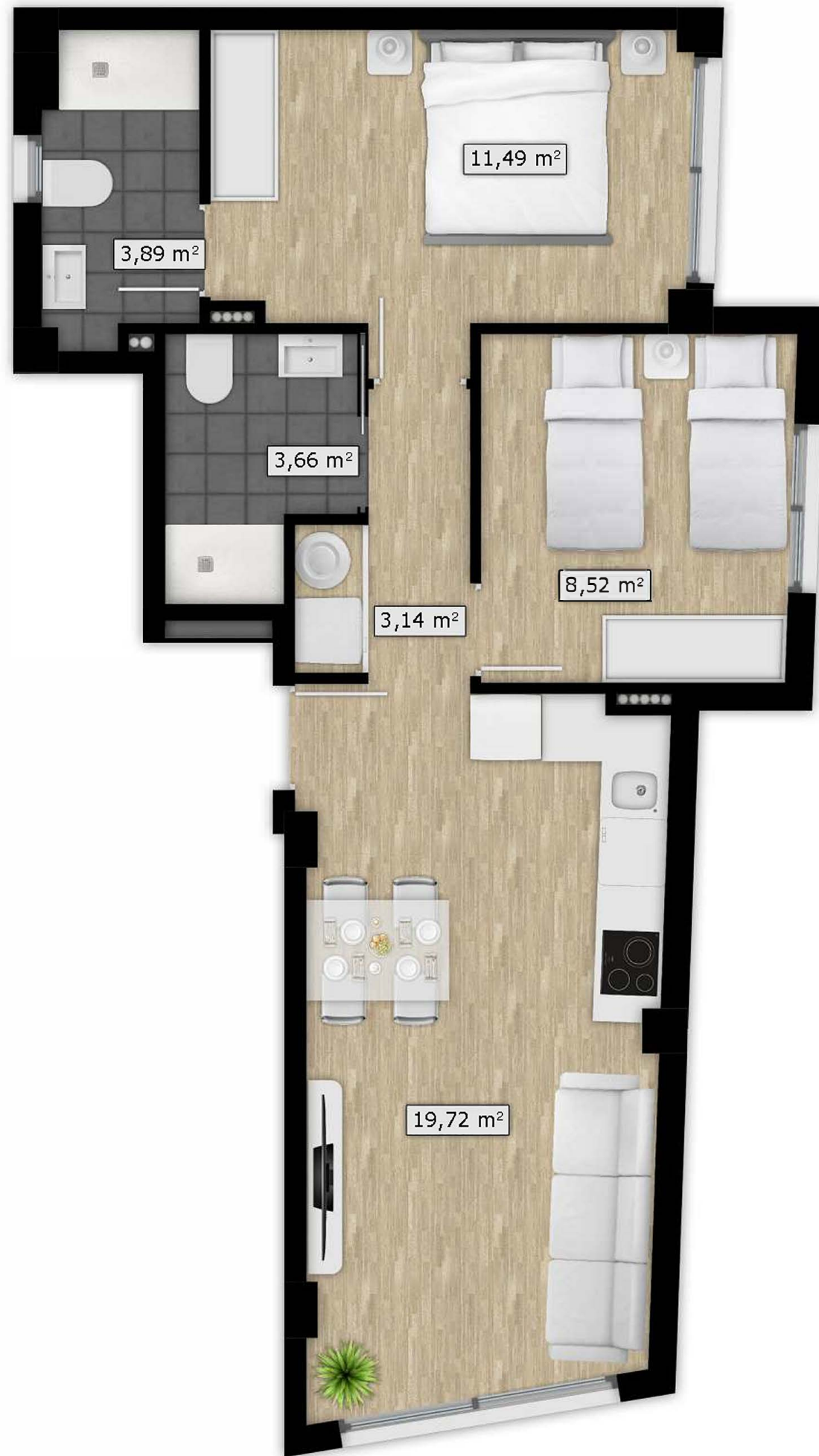
Planta pisos Vivienda 1